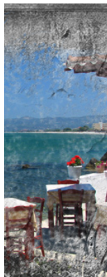
sector do turismo