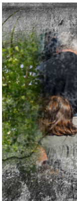
grandes temas da sustentabilidade